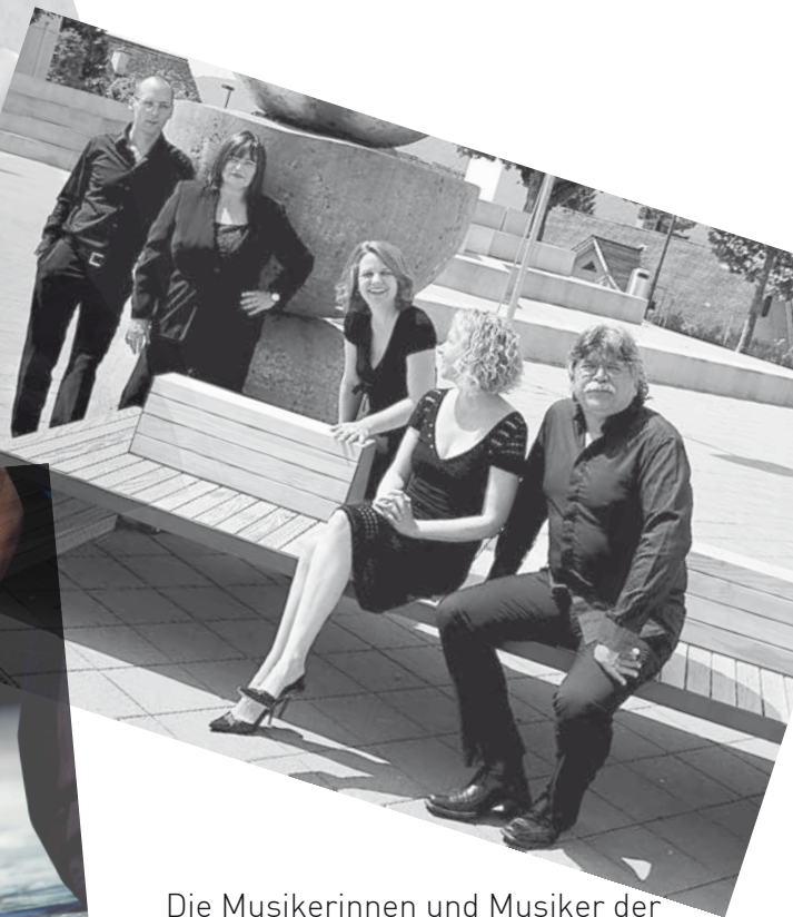
Die Musikerinnen und Musiker der Tangotanzband «malditotango» verführen Sie mit Vergnügen, Leidenschaft und Hingabe zur Musik und zum Tanz.