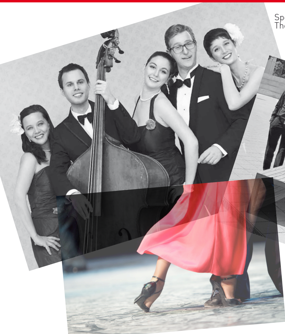
Special guests: The Sam Singers