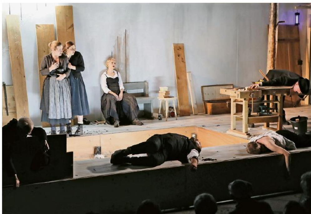
Schreckensvoll sind die Szenen von Gotthelfs «Schwarzer Spinne», die das Theater Kanton Zürich auf die Bühne bringt.