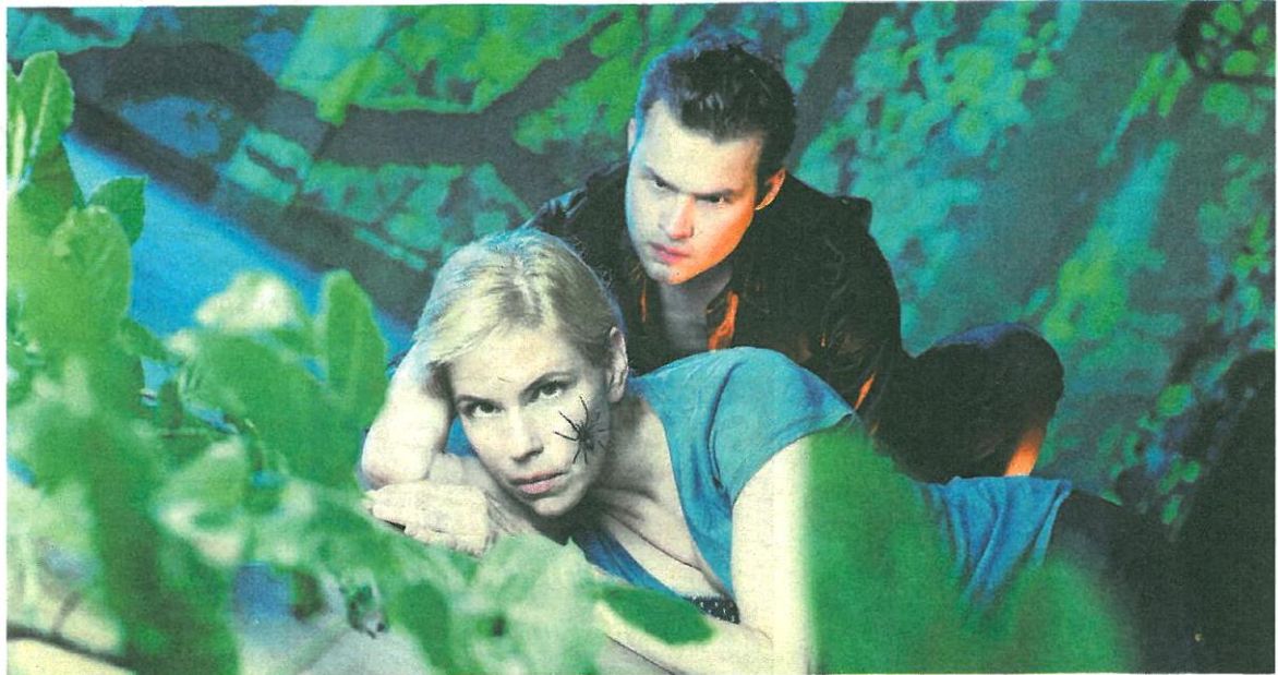
Jeremias Gotthelfs Novelle «Die schwarze Spinne» kommt per Ende Mai in die Winterthurer Altstadt.