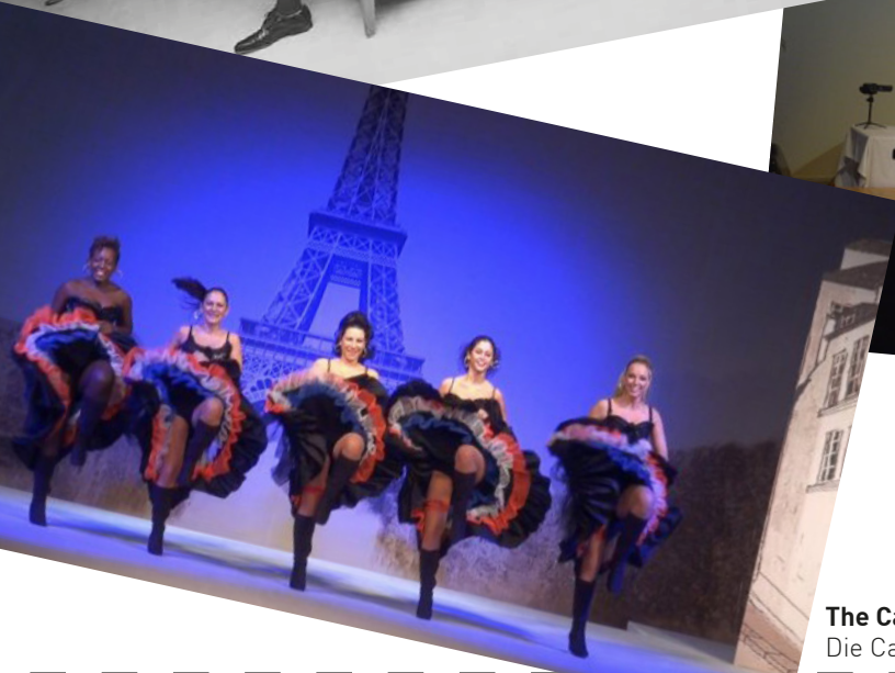
The Catwalkers Die Cancan Tänzerinnen